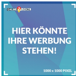
PREMIUM-BANNER 1 1000 x 1000 PIXEL

Folgende Bannerformate stehen Ihnen zur Verfügung: