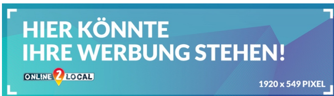
PREMIUM-BANNER WLAN 1920 x 549 PIXEL