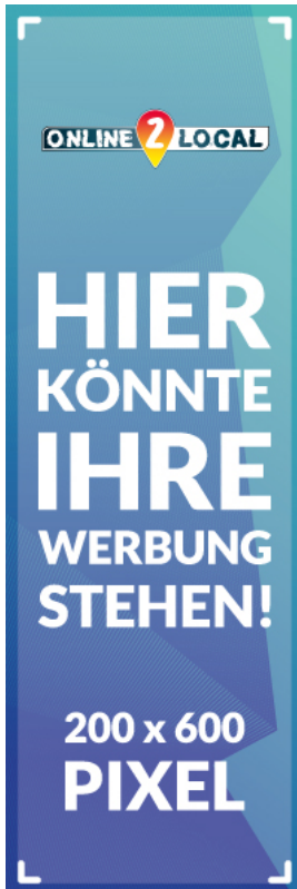
SKYSCRAPER 200 x 600 PIXEL

Folgende Bannerformate stehen Ihnen zur Verfügung: